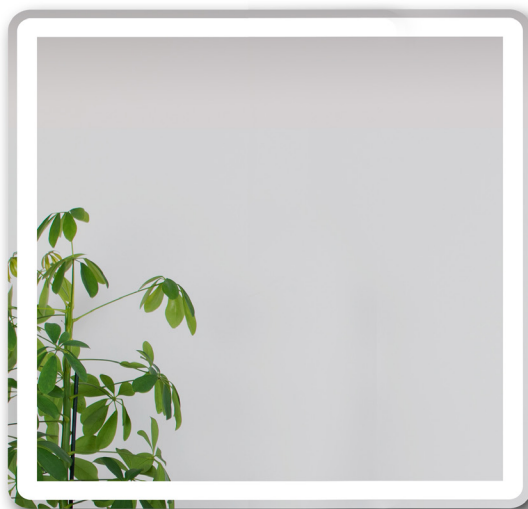
Espejo Vitara 80x80 / Vitara mirror 80 x 80