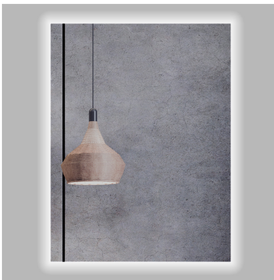
Espejo Retro 60x80 / Retro mirror 60 x 80