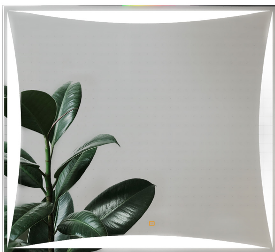
Espejo Lexus 80x80 / Lexus mirror 80 x 80