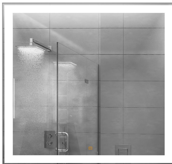
Espejo Clasic 80x80 /Clasic mirror 80 x 80